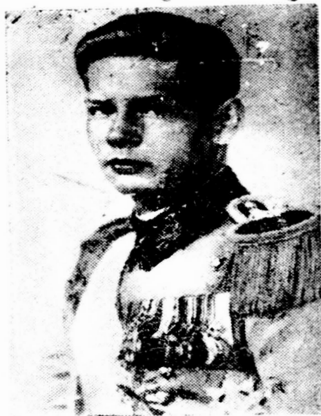
M. S. Mihai Marele Voevod de Alba-Iulia